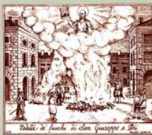
"Fallole di fuochi di San Giuseppe a Itri"

SERVIZIO NAVETTA da e per Formia e Gaeta. Orari e prenotazione: tel. 3400861836 lorenzo@esploriamo.org a cura dell'Ass. Esplor